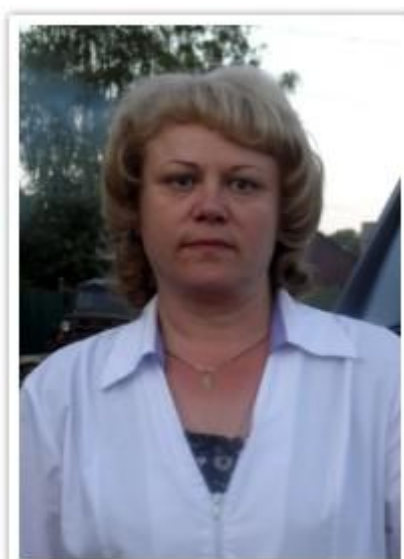
График работы: по сменный