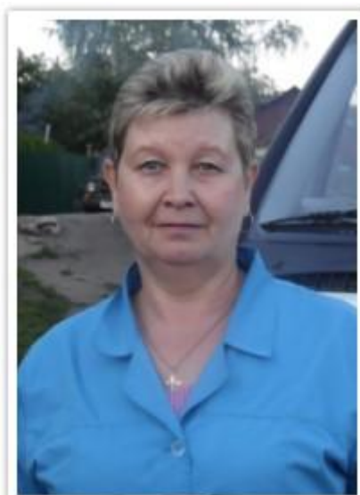
График работы: по сменный